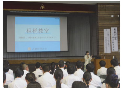
橿原学院高等学校(葛城)