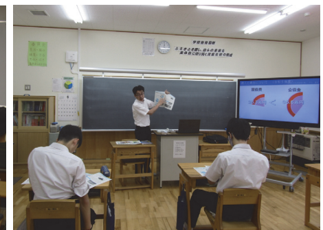
天川村立 天川小中学校(吉野)