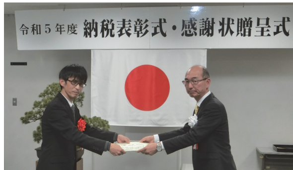
天川村立 天川小中学校(吉野)