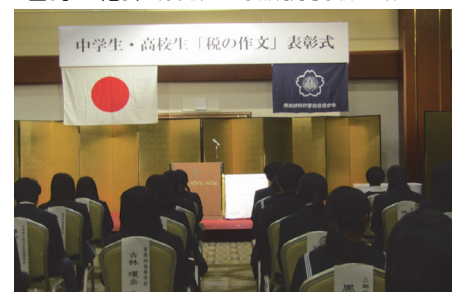
奈良ロイヤルホテル(奈良)