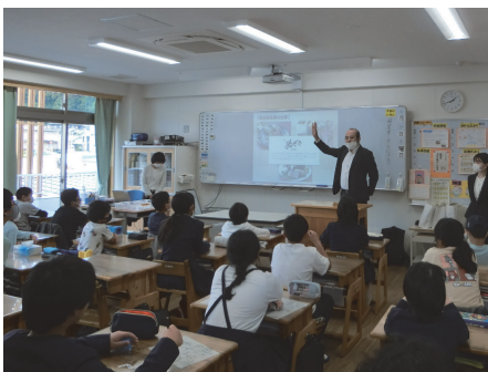
下市町立 下市あきつ学園(吉野)