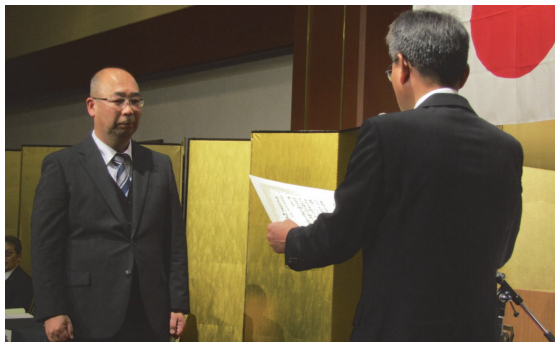
大和郡山市立 郡山西中学校(奈良)

租税教育の推進及び租税教育推進のための基盤整備等について、他の模範となる活動を行うなど、特にその功績が認められた学校及び団体に対して租税教育推進校の表彰制度を設けています。奈良県下では、今年度、以下の学校等が租税教育推進校として署長表彰を受けました。