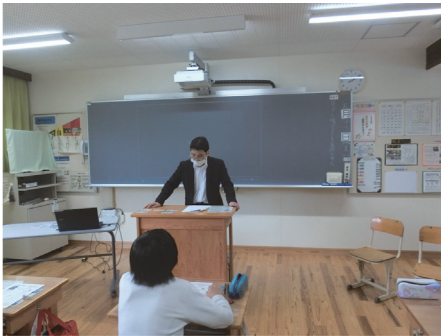
御杖村立 御杖小学校(桜井)