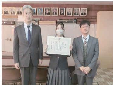
大和高田市立 高田商業高等学校(葛城)