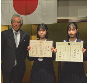
奈良 ロイヤルホテル(奈良)