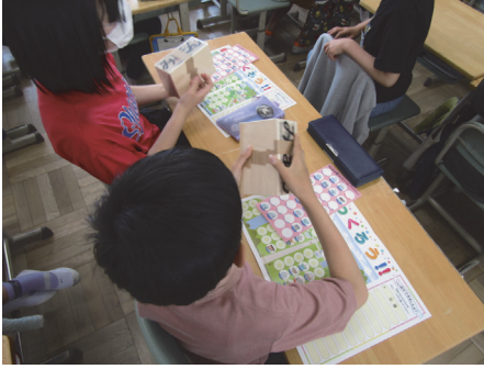
生駒市立 生駒南小学校(奈良)