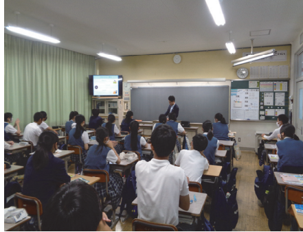
五條市立 五條西中学校(葛城)