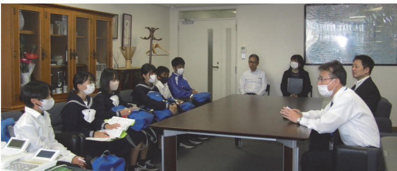
【職場インタビュー】 天理市立 北中学校(奈良)