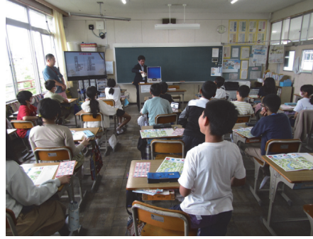
奈良市立 朱雀小学校(奈良)