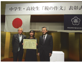
奈良ロイヤルホテル(奈良)