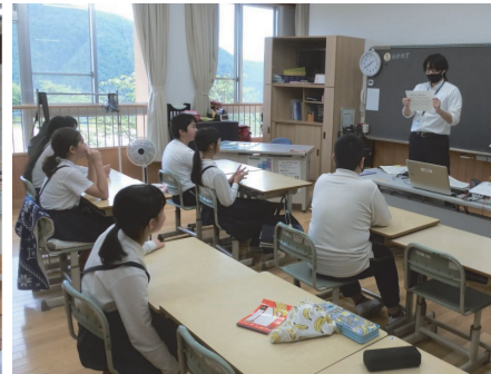
曽爾村立 曽爾小中学校(桜井)