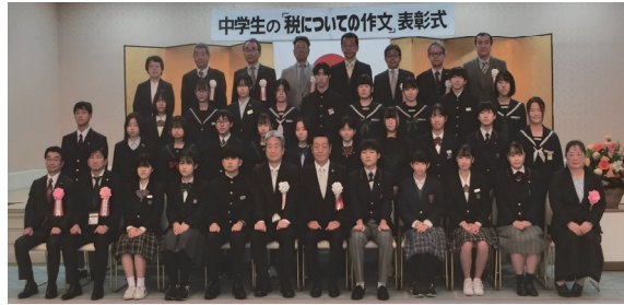
檀原神宮養正殿(葛城)