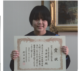
桜井市立 桜井東中学校(桜井)