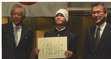
奈良ロイヤルホテル(奈良)