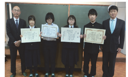
奈良県立 十津川高等学校(吉野)