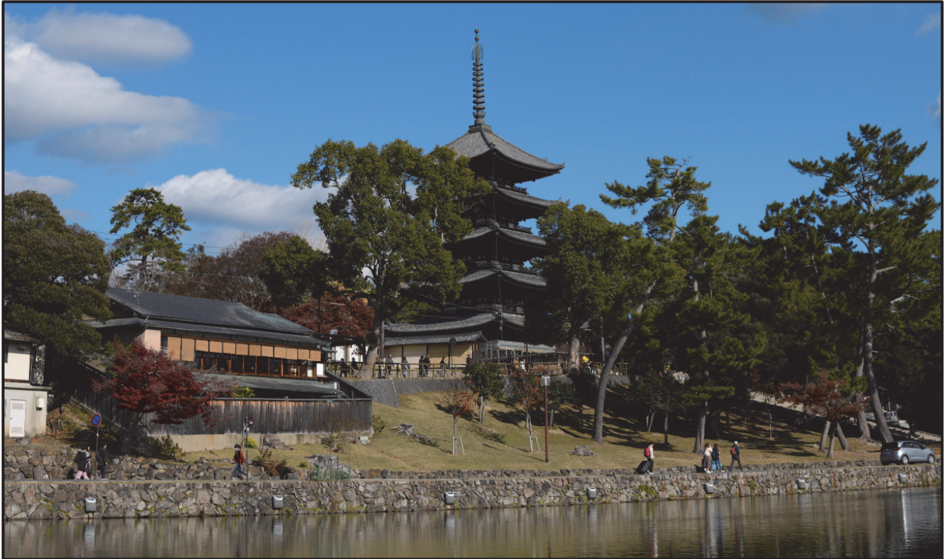
猿沢池から興福寺