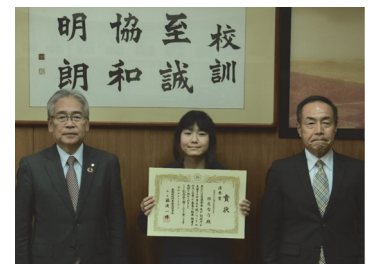
桜井市立 大三輪中学校(桜井)