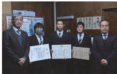
奈良県立 宇陀高等学校(桜井)