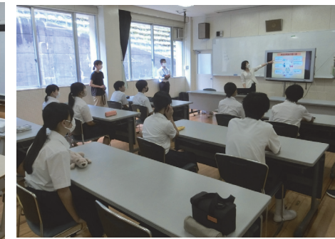
川上村立 川上中学校(吉野)