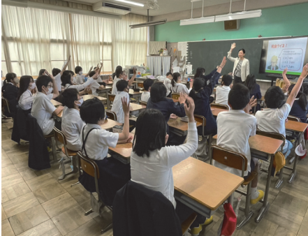
橿原市立 晩成小学校(葛城)