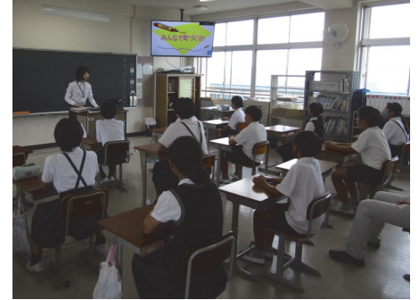
奈良市立 治道小学校(奈良)