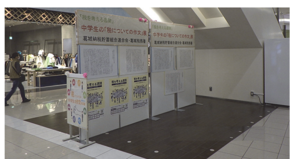
イオンモール橿原(葛城)