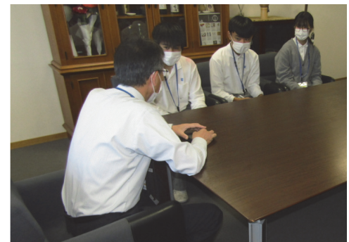
【職場体験】奈良市立 都南中学校(奈良)