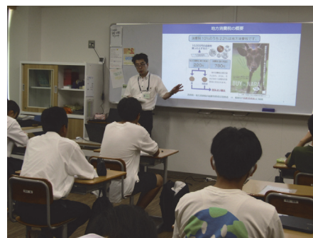
下市町立 下市あきつ学園(吉野)