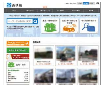
(国税庁ホームページ「公売情報」)