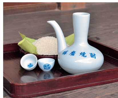
球磨焼酎の酒器 (ガラとチョコ)