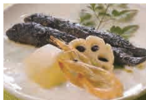
ムツゴロウの蒲焼

佐賀県産の日本酒は、その酒質から、料理とともに味わう食中酒として、比較的味の濃い料理や甘味と旨みが豊かな料理とよく調和します。