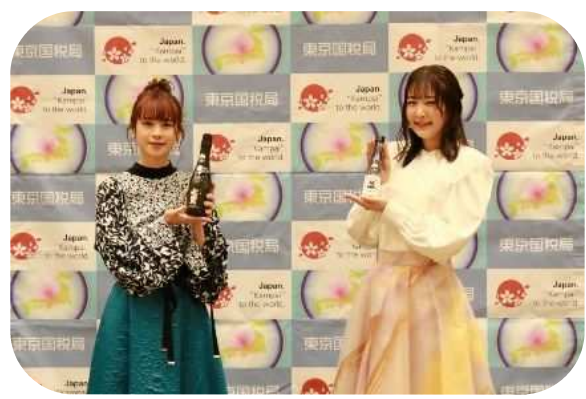
（メディア向け撮影会）