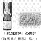
「発泡清酒」の開発 (群馬県利根郡川場村)

・老舗酒造メーカーと農業者が連携した、減農薬栽培の酒米「五百萬石」を使用した新感覚の清酒「発泡清酒」の開発。シャンパーニュ地方で見られる農業者とシャトーの信頼・共存関係を実現し、品質の高さを売りとした海外マーケットの開拓を図る。