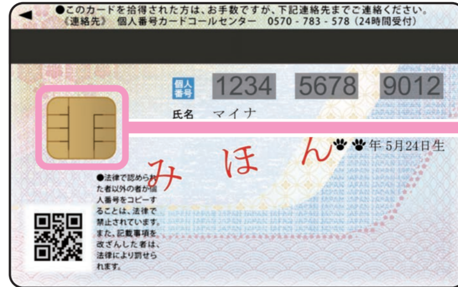
< うら面 >

うら面のICチップにあなた本人であることを証明する、「電子証明書」が入っているよ!