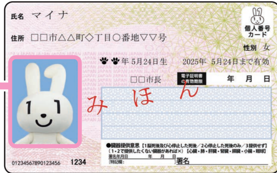
< おもて面 >